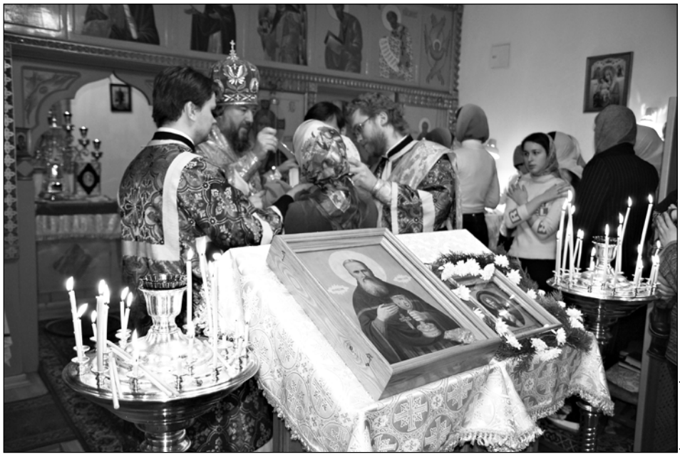
Οιοτ εαοτια: Οατοεεα.